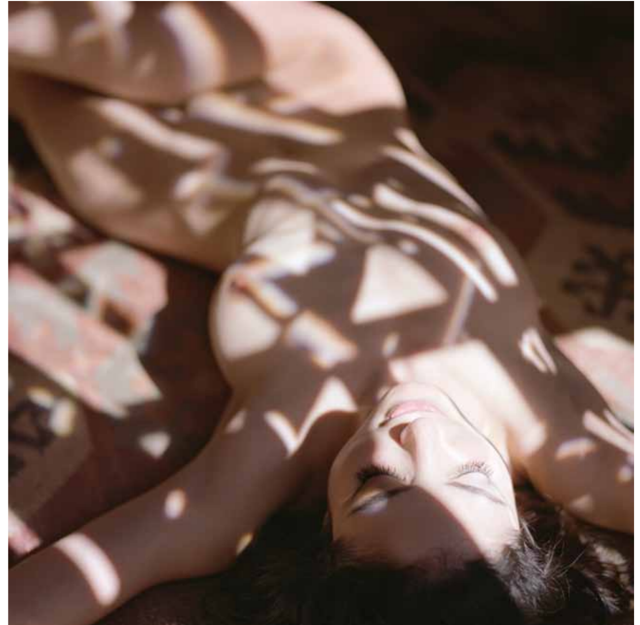
Mona Kuhn. Chanon , Private series, 2014.

It is a privilege for me to be able to photograph my close friends in the nude. I photograph the nude as a natural essence of who we are. Although we are sexual beings, I am not interested in erotic photography. I am respectful of my sitters, and take care to develop a unique visual vocabulary, apart from the mundane. For me, there is