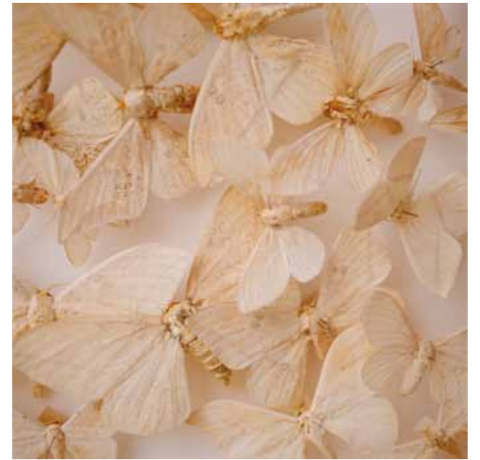
Mona Kuhn. Maya and Pan , Private series, 2014. Courtesy of the artist and Pilar Serra. Mona Kuhn. Glacial Hills , Private series, 2014. Courtesy of the artist and Pilar Serra.