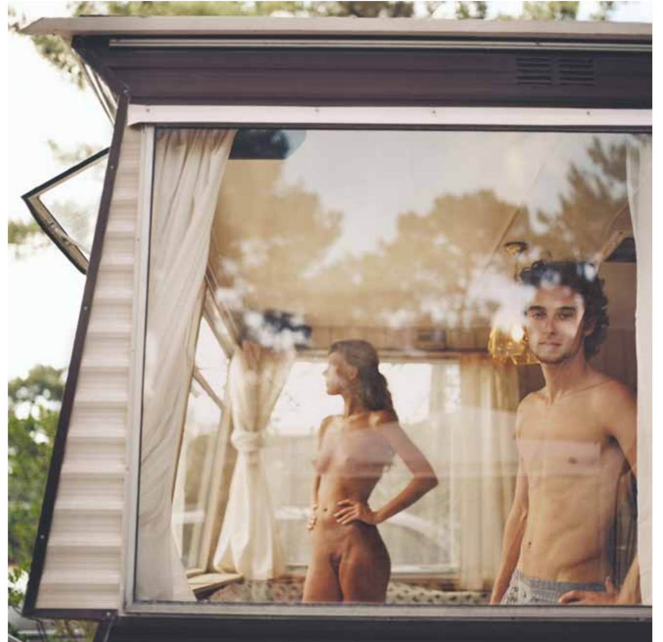
Mona Kuhn. Captured , Evidence series, 2006. Courtesy of the artist and Pilar Serra.

En 2013, fui invitada a comisariar una exposición titulada Under My Skin en la Flowers Gallery de Chelsea. Era una selección de desnudos en la fotografía contemporánea, con obras recientes creadas en su mayoría entre 2010 y 2013. Esta exposición hablaba sobre cómo el desnudo está apareciendo aquí y allá en la obra de los fotógrafos contemporáneos. Las obras seleccionadas tenían dos puntos en común: el artista o bien exploraba una nueva manera de representar un desnudo o empleaba un nuevo proceso en su lenguaje visual. Juntamos obras de Los Ángeles, Londres y Nueva York, así como de México, Corea y China, veintiséis artistas en total en representación de países y culturas diferentes.