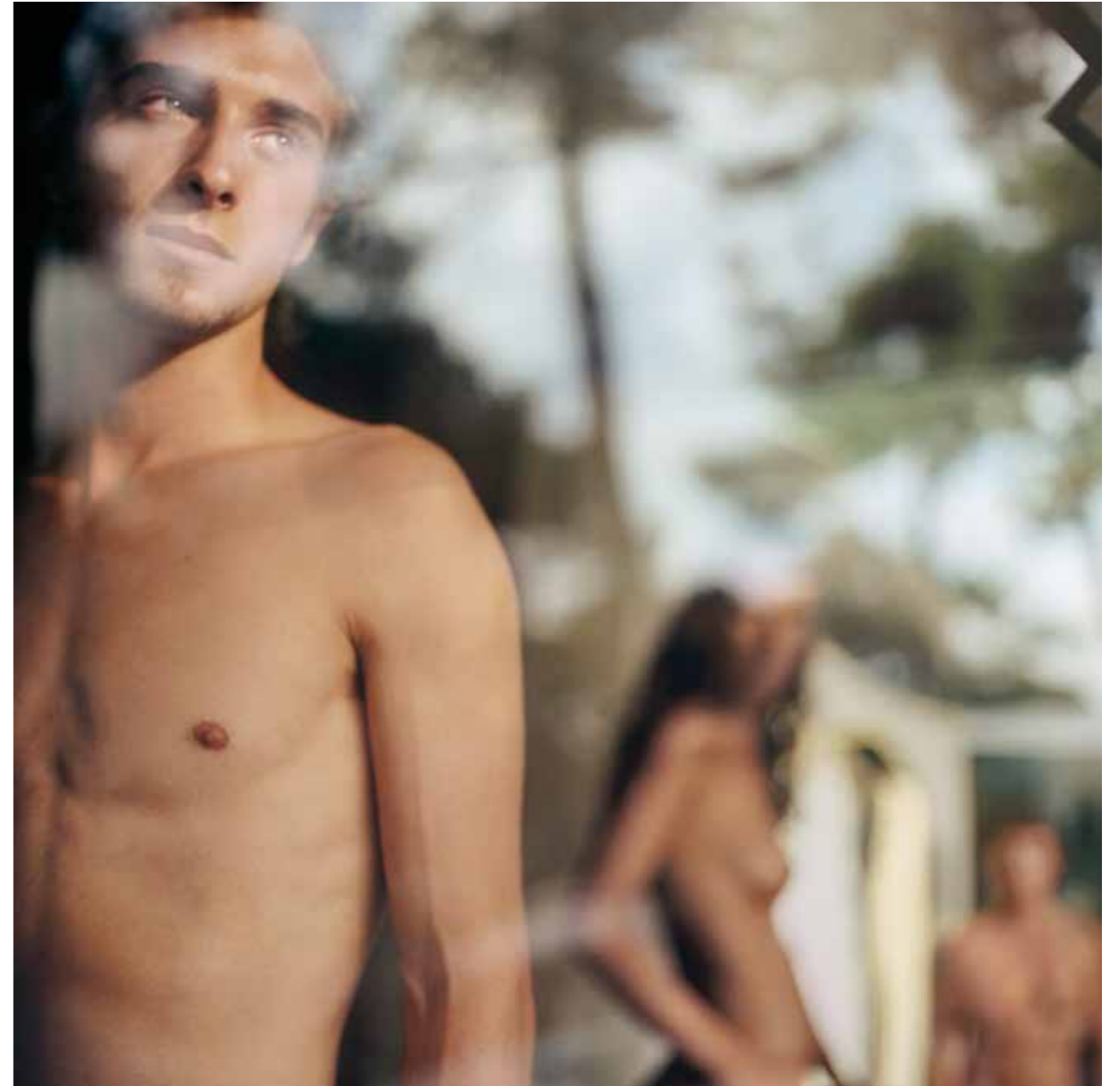
Mona Kuhn. Beyond, Evidence series, 2006.

Es un privilegio para mí poder fotografiar a mis amigos íntimos desnudos. Fotografío el desnudo como la esencia natural de quien somos. Aunque somos seres sexuales, no me interesa la fotografía erótica. Respeto a mis mode-